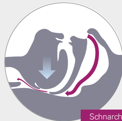
Schnarchen Gestörter Luftstrom